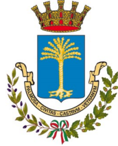
Città di Castelvetrano